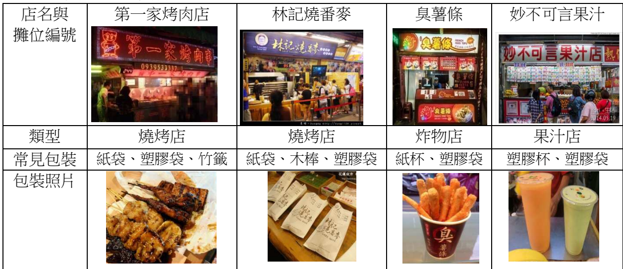
表 2-2 四家店的基本資料