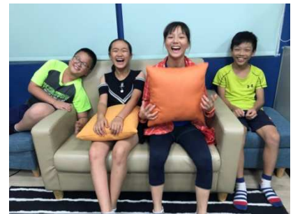
圖 1-1 研究小隊

我們的隊名叫宜昌 YES 隊，而宜昌 YES 隊中的 YES，有代表夜市的意思，在我們當初這個團隊的研究主題的最初起源其實在五年級就開始了！在一開始，我們有兩位導師帶領減塑，因為大家對減塑都很有興趣，所以在專題研究時，我們決定要以東大門夜市為研究地點，開始著手研究，當初隊員有八個人，後來因為小論文比賽人數限制，所以老師採用學生自願參加的方式，因此我們這個四人小組就成軍了，我們決定以「『夜市很有塑！』—民眾於花蓮東大門夜市使用塑膠製品之研究」為研究主題。