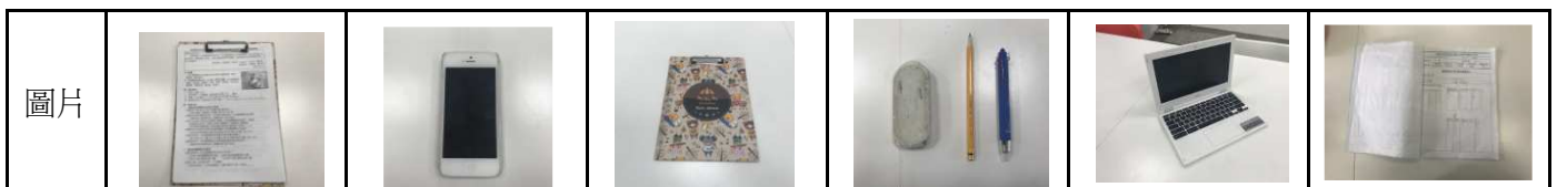
表 2-3 研究器材與用途表

我們在最常使用的工具是電腦和手機，它們可以：查資料、整理資料、拍照，以及紀錄研究時的過程。在實際觀察時，我們用到了紀錄表、夾板以及文具，分別可以用來記錄遊客使用一次性塑膠製品的行為、固定紀錄表、方便寫問卷及紀錄。各項研究器材項目與用途，詳見表 2-3：