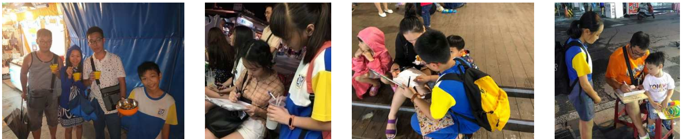
圖 2-2 至 2-5 學生至東大門夜市進行問卷調查

本研究為了瞭解民眾對於塑膠製品使用現況、看法與無塑夜市施行的想法，以自編問卷「民眾對於東大門夜市一次性塑膠餐具及包裝與無塑夜市之看法問卷調查表」，問卷編製初期是依據三大研究目標每人發想各 5 個題目並參考相關減塑議題問卷後，發想總計 60 題問題，經過小組初步將題意重覆、偏離主題的問題刪去後，將最初版問卷請家長試填，並把家長的意見加入調整題意與選項，最後再以心智圖確認各個研究目的細部概念發展補充題目後，再次請家長與指導老師共同檢視問題適切性後，成為正式版問卷(如附件二)，最後特別挑選中秋連假東大門夜市來客數可能最多的時間，以隨機抽樣方式發放問卷 115 份，回收有效問卷 100 份。