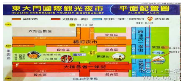
圖 2-6 東大門夜市平面配置圖

在東大門夜市實地觀察中，為了要了解夜市實際使用一次性塑膠的情形，特別選擇網路部落客推薦的著名店家，在店家的選擇上也盡量有不同類型的店家，為了方便小組團體行動，因此由東大門 E 區選擇著名且性質不盡相同的四家店分別是第一家烤肉店、林記燒番麥、臭薯條及妙不可果汁店，其分布位置如圖一。透過觀察這四家店購買的民眾外帶時所用的包裝進行結構化觀察紀錄。