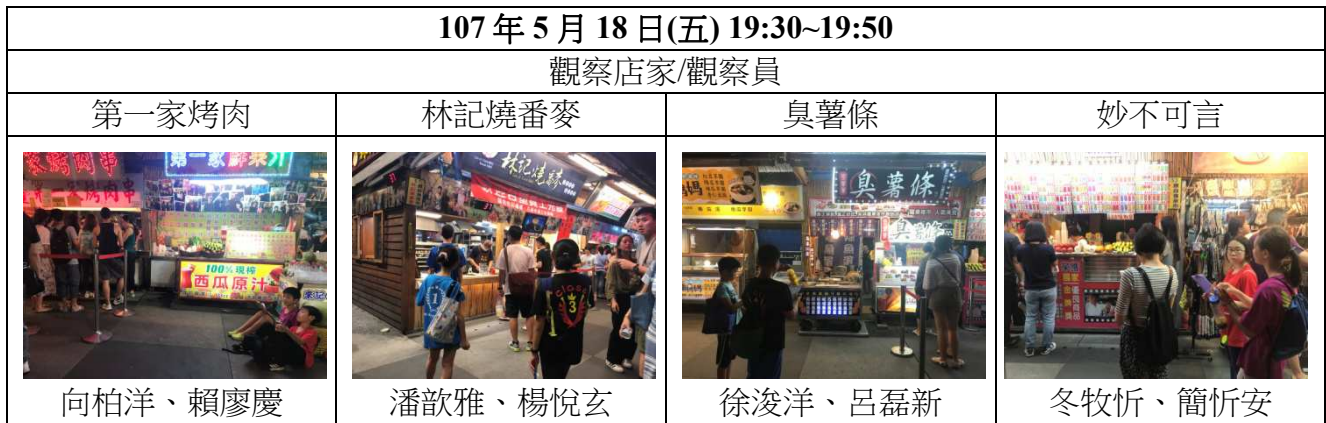
表 2-1 觀察時間與人員分配表